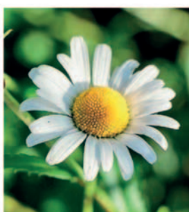
Wiesen-Margerite Blütenkörbchen ca. 5 cm breit, mit breiten weissen Zungenblüten, unverzweigte Stängel