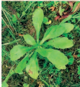
Überwinterung als Rosette