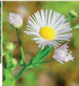
Blütenkörbchen 1-2 cm breit, viele schmale Zungenblüten in weiss bis lila, blüht von Mai bis Oktober