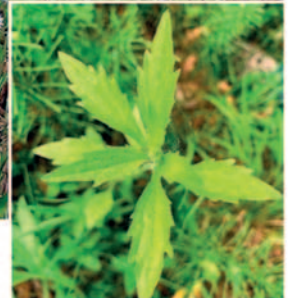
Hellgrüne behaarte Blätter, am Rand grob gezähnt