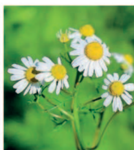
Echte Kamille Geteilte Blätter, breite Zungenblüten, stark aromatisch