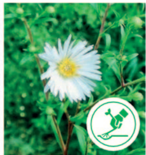
Lanzettblättrige Aster Blütezeit ab August, Blätter dunkelgrün, schmal, nur fein gezackt, ohne Haare → ebenfalls ein Neophyt