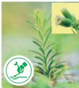
Kanadisches Berufkraut Ein Hauptstängel, rund 100 Blüten, kurze Zungenblüten → ebenfalls ein Neophyt