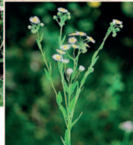
Behaarte Stängel, oben verzweigt, bis 1,5 m hoch