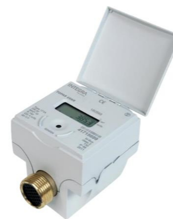
Funkwasserzähler (TOPAS ESKR).

Wir haben uns mit der Herstellerfirma Aquametro AG über dieses Urteil unterhalten und erfahren, dass es sich bei diesem Urteil um ein Gerät von einer Mitbewerberfirma handelt. Die von uns evaluierten Geräte sind von allen Stellen national und international zugelassen und können problemlos eingebaut und betrieben werden.