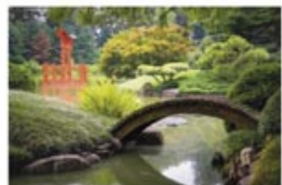
Botanischer Garten «Hruska-HELLER»