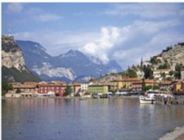
Hafenstädtchen Torbole sul Garda